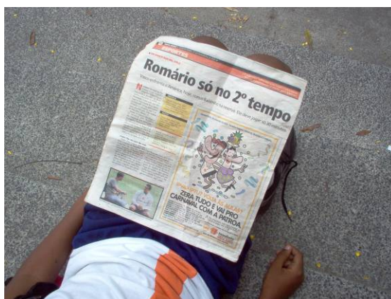
Menino com jornal passado no colo

Nos degraus que conduzem à entrada da escola, senta-se o menino. No colo, um jornal gasto. Chama atenção o destaque para a notícia “Romário só no 2º tempo”. Nas últimas semanas, o atacante aproximava-se do gol mil da carreira. Nas páginas esportivas, é o assunto principal. O jornal vencido e a notícia que não se deixava consumir pelo tempo 1 , porque seu personagem protagonizava a virtual realização de um grande feito, compõem, na fotografia, uma ilustração da complexidade do cotidiano, com sua estrutura híbrida de tempos e espaços. Não vi o menino lendo a matéria. Mas a arrumação do jornal no seu corpo não nos faz acreditar em uma casualidade qualquer. O título parece ter prendido seu interesse, mesmo para um assunto aparentemente desatualizado diante do caráter diário do jornal. De todo modo, temos aí um acontecimento sem dúvida comum, mas irrequieto para