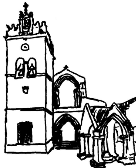
Fig. 1 – Igreja de Nossa Senhora da Oliveira

Mas, ao longo dos tempos teve numerosas alterações. A torre da Igreja só foi construída mais tarde, no século XVI.